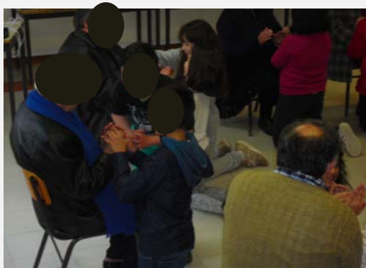
Figura 7. Exercício da Rosa/flor (aula de dança)

Exercício expressivo/corporal que materializou a flor com as mãos dos 'avós' e 'netos' (a partir de uma música) e com diferentes movimentos "espalhavam" o perfume da Rosa (cf. Figuras 7 e 8).