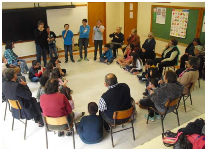
Figura 1. Formação espacial adotada no processo de trabalho

As quadras escritas pelas crianças, na Oficina de Escrita Criativa, foram musicadas 2 pelo Professor de Música do Centro de dia, tendo sido o elemento condutor do processo de criação artística/composição coletiva. De salientar que duas das quadras ocuparam o lugar de Refrão (cf. Quadro 1), cantadas pelos intervenientes durante a composição.