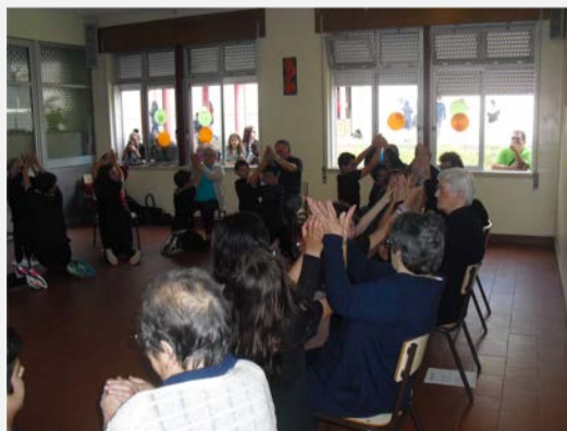
Figura 8. Exercício da Rosa/flor (apresentação à comunidade)