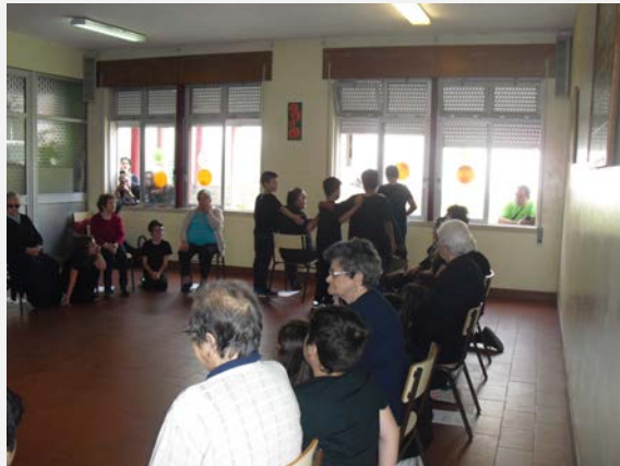
Figura 11. Exercício da tristeza/ saudade (o menino ficou sozinho)

Exercício expressivo/corporal que representou a tristeza/ saudade, com uma música sugestiva ao tema: os 'avós' e os 'netos' representaram o "menino" que ficou sozinho e os restantes 'avós' e 'netos' exploraram movimentos que mostraram a saudade (cf. Figuras 11 e 12).