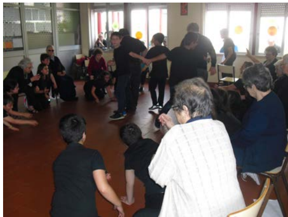
Figura 10. Exercício do medo

andar pelo espaço a ser mordido pelos polvos (realizado pelos restantes 'avós' e 'netos' com movimentos dos membros superiores) para largar a menina do mar (cf. Figura 10).