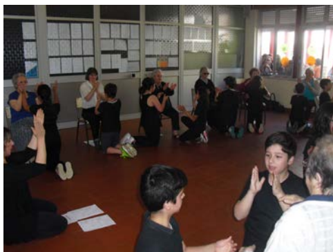
Figura 5. Exercício do brincar/alegria