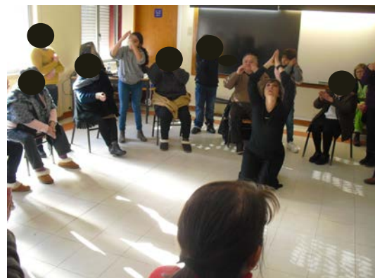
Figura 9. Exercício do Fósforo/fogo (processo criativo)

Exercício expressivo/corporal da materialização do fogo, com uma música sugestiva ao tema: os 'avós' eram a caixa de fósforos e os 'netos' eram o fósforo, com formas de corpo; de seguida, os 'netos' exploravam movimentos que representavam o acender do fósforo na caixa e aparecia o fogo, que era explorado por ambos com movimentos envolvendo as partes do corpo (cf. Figura 9).